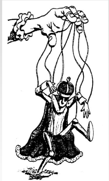
O "heroísmo de D. Pedro" não explica a Independência do Brasil.